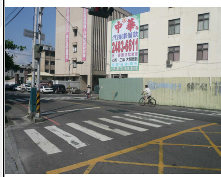
2. 學校外面左側道路