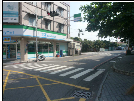
3. 學校外面右側道路