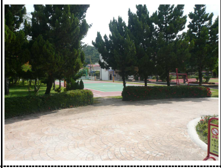
4. 運動場所入口方向