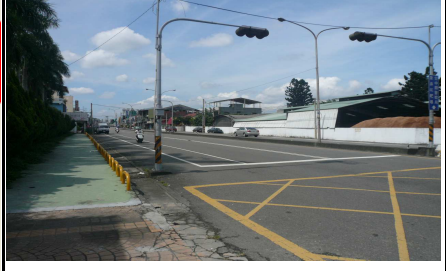
2. 學校外面左側道路