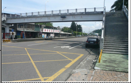
3. 學校外面右側道路