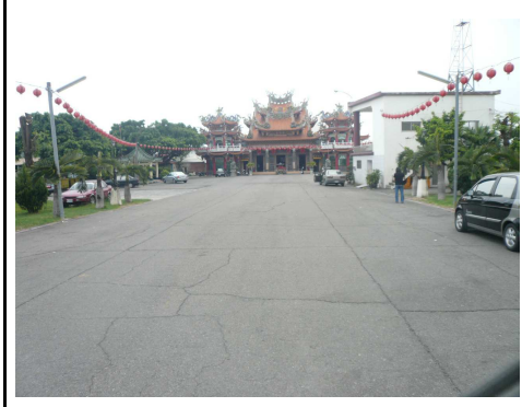
4. 運動場所入口方向