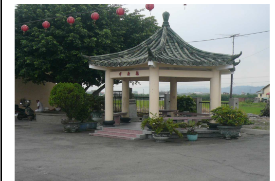
6. 運動場所休息設施

◎地圖資料來源：台灣 Google 地圖 ◎照片資料來源：霧峰區衛生所（莊秀娟）、志工群（台中教育大學，王俊維，2010）