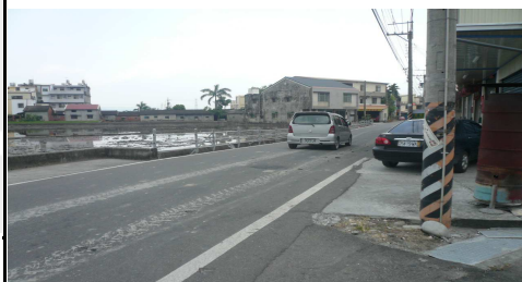
3. 福新宮外面右側道路

◎地圖資料來源：台灣 Google 地圖 ◎照片資料來源：霧峰區衛生所（莊秀娟）、志工群（台中教育大學，王俊維，2010）