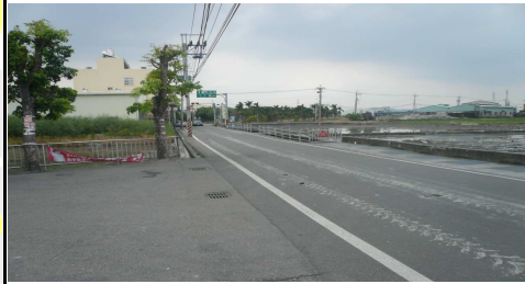
2. 福新宮外面左側道路