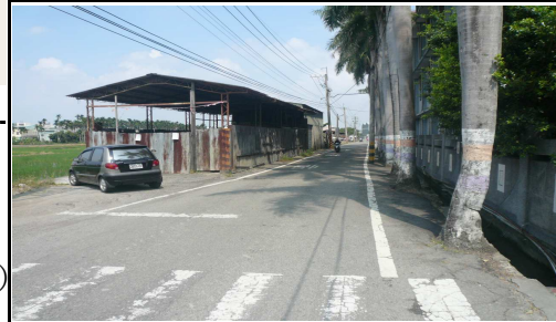
3. 學校外面右側道路