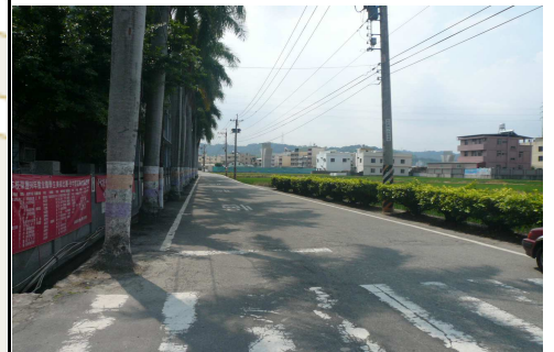
2. 學校外面左側道路